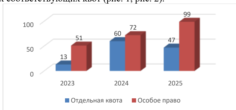
Рис. 1. – Динамика поступления по отдельной квоте и особому праву ФГБОУ ВО "Мелитопольский государственный университет" за 2023-2025 гг.

Как в рамках отдельной квоты, так и в рамках особого права наблюдается увеличение количества зачисленных абитуриентов по всем формам подготовки обучающихся. При этом в 2025-м году, в течении вступительной кампании которого наблюдался уверенный рост интереса абитуриентов, обладающих такими правами, зачисление по соответствующим квотам происходило практически по всем открытым направлениям подготовки. Потенциал подобных механизмов поддержки для ФГБОУ ВО «Мелитопольский государственный университет» демонстрирует динамика и структура зачисления в рамках соответствующих квот (рис. 1, рис. 2).