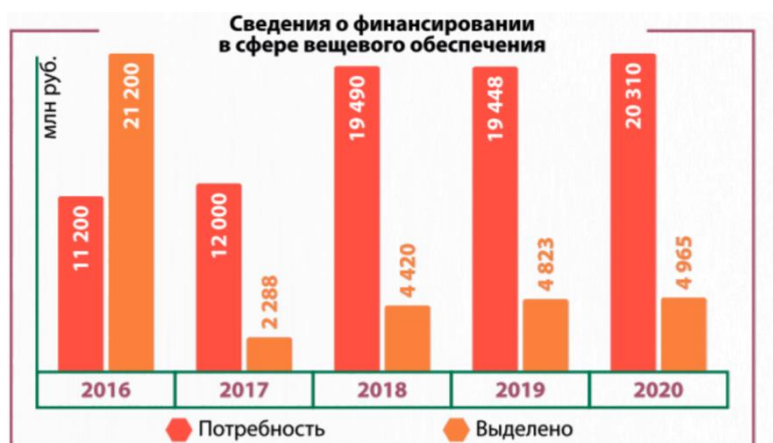
Рис.3. Статистика МТО Росгвардии в 2016-2020г.

Изучив теоретические аспекты организации материально-технического обеспечения войск национальной гвардии, обратимся к исследованию статистических данных, свидетельствующих о реализации системы МТО на практике. На сайте Росгвардии размещены отчеты об осуществлении материально-технического обеспечения с года образования данных войск по 2020 год (рис.3.). Представленные сведения свидетельствуют о том, что потребность в средствах для исполнения основных рабочих функций была удовлетворена только в 2016 году, в остальной период (за 2021-2023 годы данные на официальном сайте отсутствуют) средств выделяется в 4-5 раз меньше, чем имеется потребность.