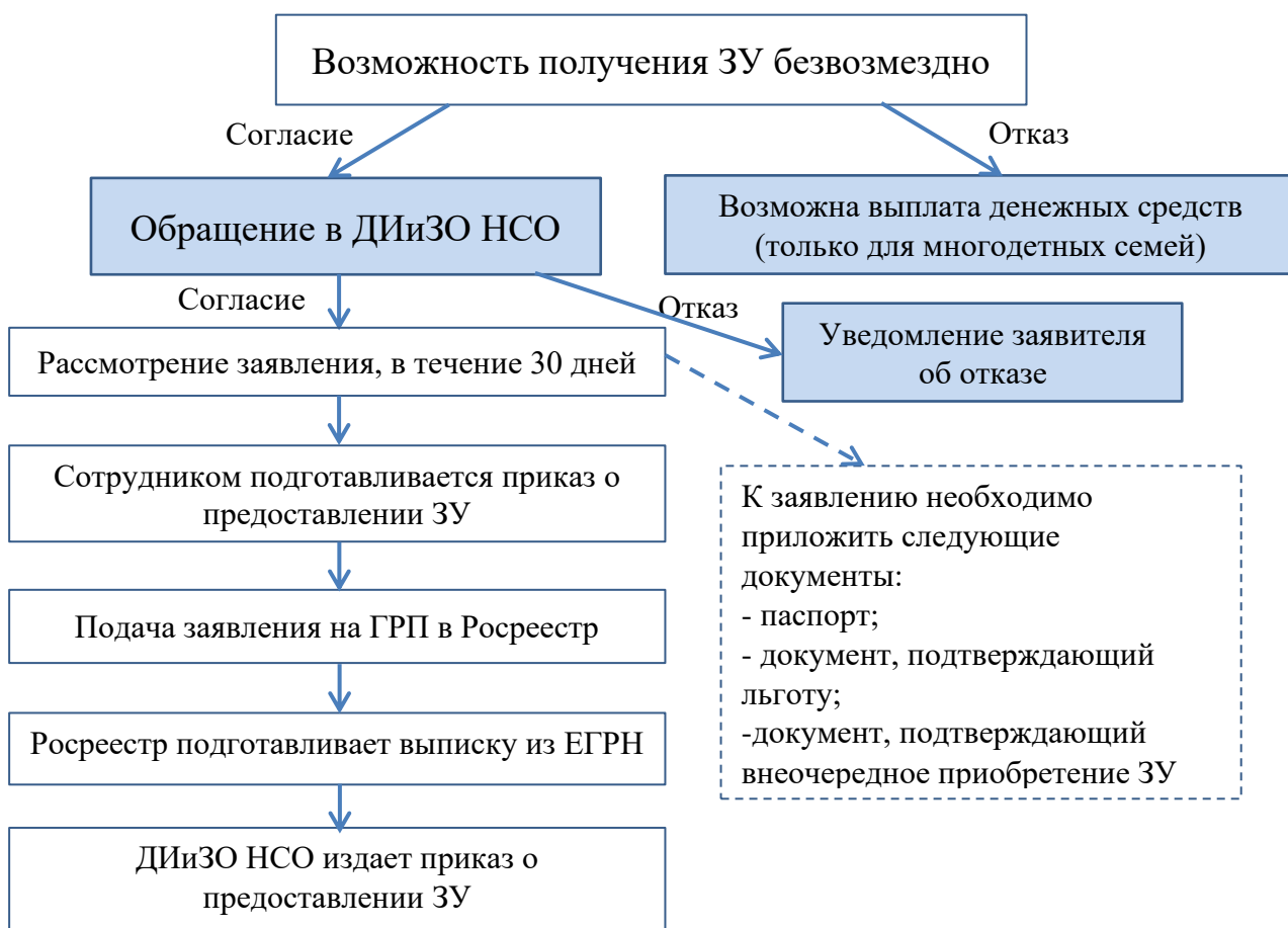
Рис. 2. Схема процесса предоставления земельного участка льготным категориям граждан

граждан, имеющих право на данную материальную поддержку от государства [1]. Например, на территории Новосибирской области Департамент имущества и земельных отношений Новосибирской области (ДИиЗО) осуществляет процедуру предоставления земельных участков, но проведение этой процедуры также распространяется на подведомственные органы и органы, взаимодействующие на условиях государственного контракта [5]. Схема процесса предоставления земельного участка льготным категориям граждан представлена на рис. 2.