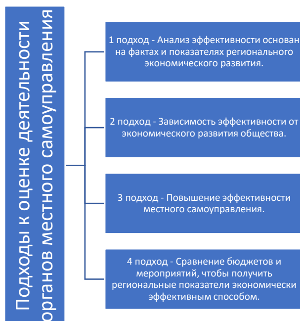
Рисунок 1 - Основные подходы к оценке деятельности органов местного самоуправления

В ходе мониторинга, если в отчетном году регион не имеет одного или нескольких показателей эффективности, значение устанавливается равным нулю. Поэтому важно сосредоточиться на важных областях и секторах.