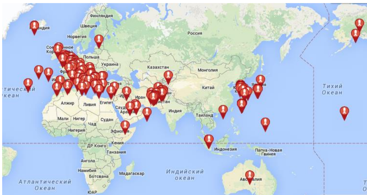
Рисунок 2. Карта военных баз США за рубежом

Значительная часть из представленных на рисунке горячих точек находится в непосредственной близости от границ России или имеет стратегическое значение для экономических, политических, военных интересов нашей страны (в т. ч. российского бизнеса или стран, с которыми Россия имеет тесные военно-политические и экономические связи).