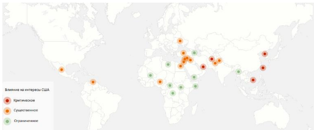
Рисунок 1. Карта военных конфликтов в 2019 г. (по данным АСМД) [5]

По данным Американского Совета по международным делам (англ. Council on foreign relations, далее — АСМД) в мире сегодня насчитывается 26 военных конфликтов различной степени напряженности, 5 из которых АСМД оценивает как критические для интересов США, а 12 как существенные. Американский Центр всеобъемлющего мира (англ. Center for systemic peace — CSP [4]) по данным на начало 2017 года насчитал 36 войн, Институт исследования мира в Осло (англ. Peace Research Institute Oslo — PRIO) в 2014 году идентифицировал 40 конфликтов, в 2013 году — 34 (рис. 1).