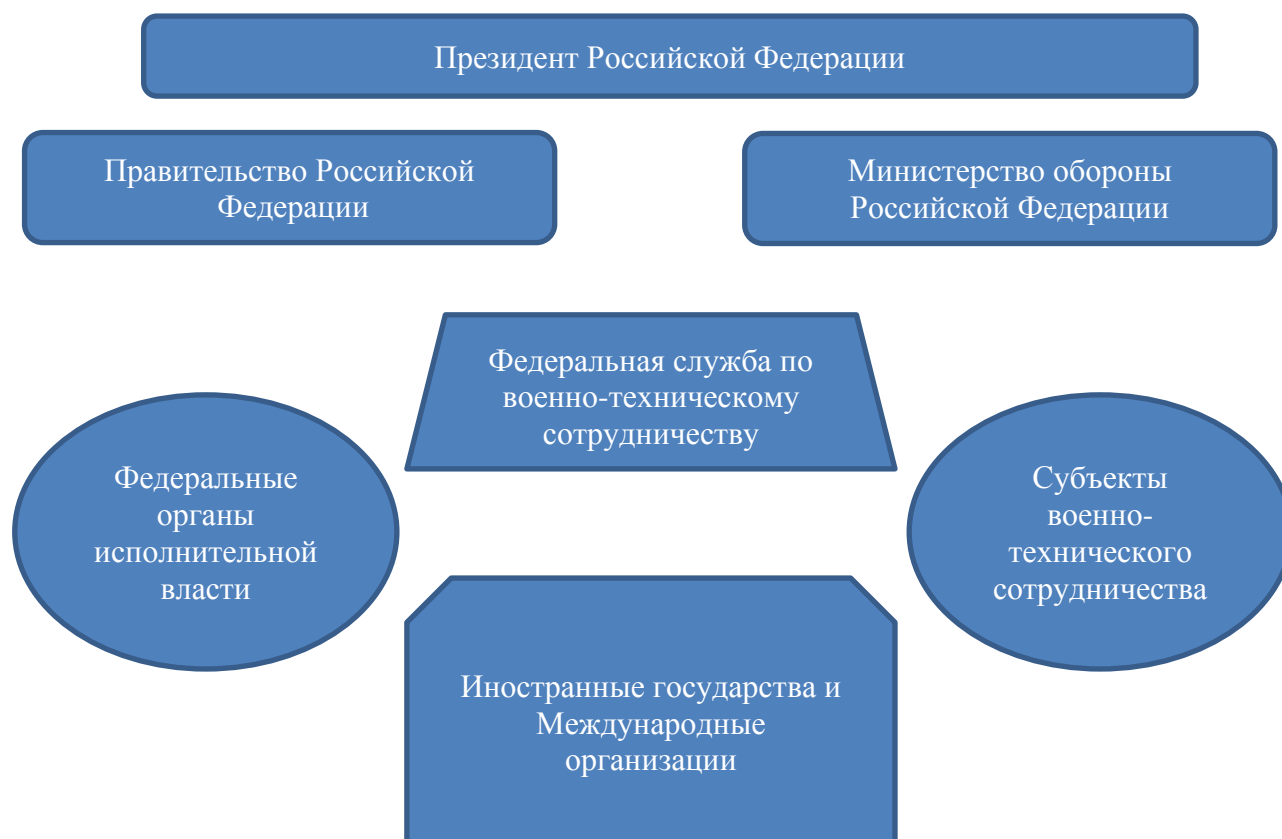
Рисунок 2. Структура военно-технического сотрудничества (Указ Президента РФ от 10.09.2005 № 1062 (ред. от 03.08.2020) «Вопросы военно-технического сотрудничества Российской Федерации с иностранными государствами»)

Для России военно-техническое сотрудничество с иностранными государствами является уникальным средством обеспечения национальных интересов, поскольку торговля оружием оказывает огромное влияние на международную обстановку через изменение баланса сил в различных регионах, способствуя подогреву или, наоборот, сдерживанию агрессоров, поддержанию или нарушению региональной стабильности.