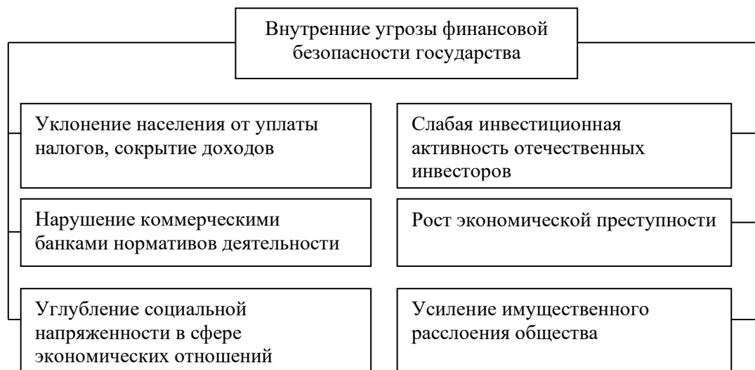
Рисунок 2. Примеры внутренних угроз финансовой безопасности государства

Существует также классификация, разделяющая угрозы финансовой безопасности по степени их влияния на прямые и косвенные. Первые оказывают непосредственное прямое воздействие на финансовую систему страны, а косвенные воздействуют через дополнительные факторы [6].